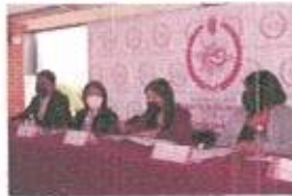
COESPO Nota 1: Coespo...