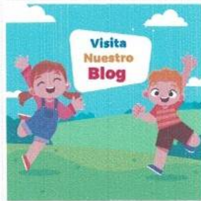
BLOG sobre Crianza Positiva